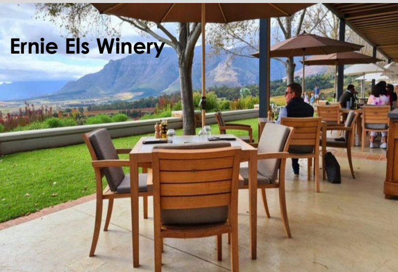
Ernie Els Winery