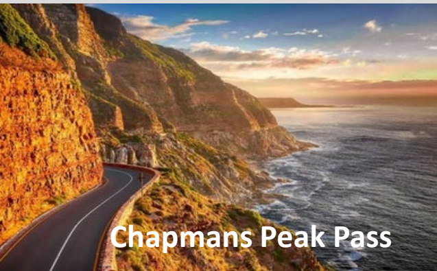
Chapmans Peak Pass