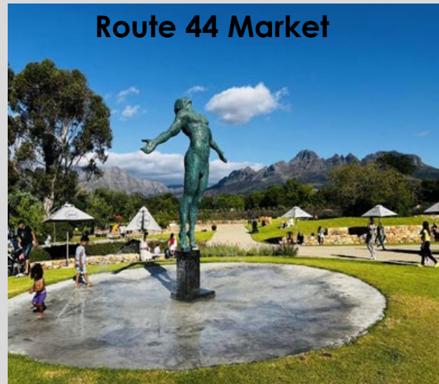
Route 44 Market