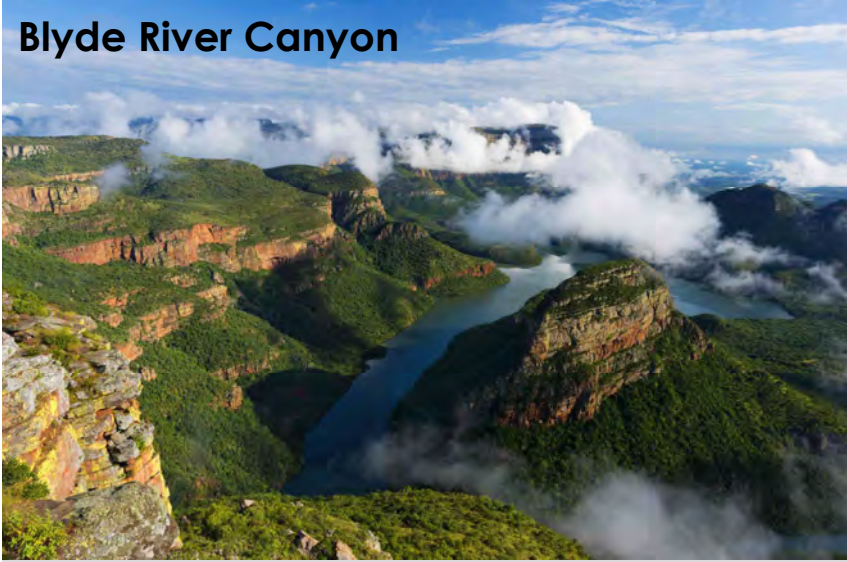
Blyde River Canyon